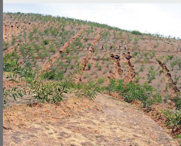
Kiszáradt területek helyreállítása Chilében az Action Against Desertification program keretében

2014. október 22-én jelentették be, hogy az Európai Unió és az ENSZ Élelmezési és Mezőgazdasági Szervezete (FAO) együttműködve az ACP (African, Caribbean and Pacific Group) országokkal elindított egy 41 millió eurós, négy és fél éves programot, mely a fenntartható termőföld növelését és a kiszáradt területek helyreállítását tűzte ki célul. Az Action Against Desertification elnevezésű program a klímaváltozás okozta éhínség és szegénység elleni küzdelemben elengedhetetlenül fontos a program támogatói szerint, mert a népességnövekedés és az éghajlatváltozás miatt a helyi ökoszisztémákra nehezedő egyre nagyobb nyomás, az elsivatagosodás és a termőföldek kimerülése a fő oka sok konfliktusnak.